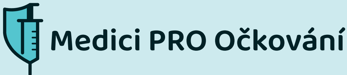
Doplňkové varianty logotypu